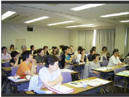
当日の会場風景です。